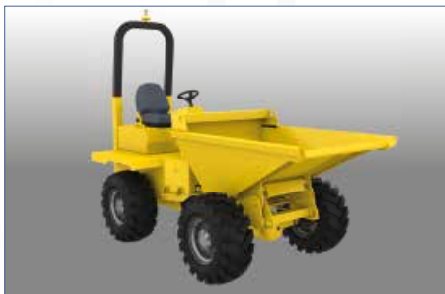
Motocarriole e Mini Dumper