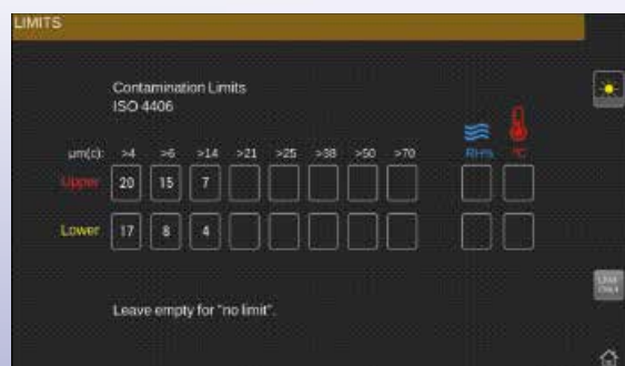
Sistema software intuitivo e personalizzato

Il CML4 mostra i risultati in tempo reale sul display ad alta risoluzione. Progettato per garantire la massima semplicità, il software consente ai nuovi utenti di essere operativi in pochi minuti senza la necessità di una formazione.