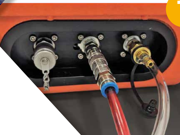
Raccordo di aspirazione e scarico rifiuti in uso

Il primo passo consiste semplicemente nel collegare il CML4 ad un punto di prova Minimesse online (gamma di pressione 2-420 bar / 29-6091 psi) o al serbatoio delle applicazioni (pressione zero). Il CML4 è dotato di una pompa di dosaggio che consente l'analisi dei sistemi non pressurizzati. I collegamenti idraulici standard sono facili da utilizzare e mantengono elevate le caratteristiche di protezione ambientale.