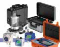
PRODOTTI PER IL MONITORAGGIO DELLA CONTAMINAZIONE