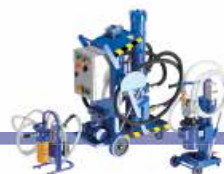
UNITÀ MOBILI DI FILTRAZIONE